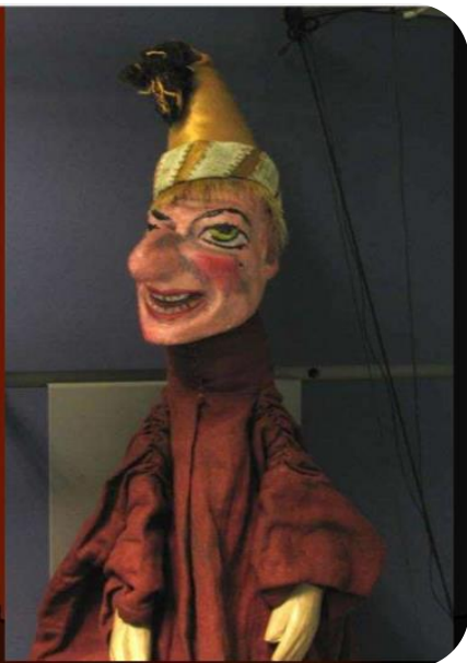
Полишинель – французский Петрушка